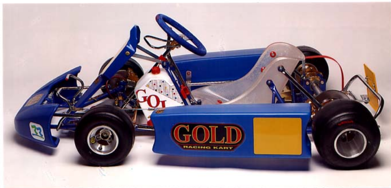
Photo du Kart avec carrosserie et pneumatiques

This homologation sheet reproduces descriptions, technical drawings and dimensions at the moment of the FMK-FIA homologation. With its homologation application, the applicant confirms, that all the requirements of the regulations are respected in full.